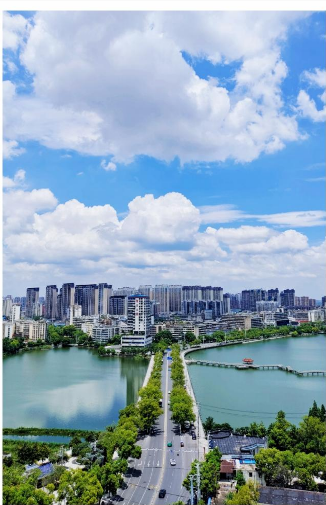
碧天楼影

晨练结束，大家结伴下山。阳光渐渐明亮，给每个人的身影镀上一层金边。山脚下早点铺早已热气腾腾，菜场里也开始喧闹起来。一路上，鼻尖萦绕着诱人的香气：米粥的清甜、油条的酥脆，还有包子蒸笼里飘出的腾腾热气，仿佛连空气都变成了活泼的