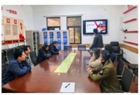
验证的闭环管理机制。针对可能发生的各类突发事件，培训提供了清晰的应急处置流程与实操指引，以提升现场快速响应与处置效能。本次培训最终落脚于安全文化建设，倡导培育全员参与的“主人翁”意识，强化规范操作、隐患上报与相互监督的责任感，共同构筑“人人讲安全、事事为安全”的坚固防线。

培训聚焦水厂生产实际，系统强化了设备操作、水质检测、化学品投加及有限空间作业等关键岗位的安全规范，推动员工从“要我安全”向“我要安全”深度转变。通过深入剖析氯气泄漏、有限空间事故等典型警示案例，深刻揭示违章作业的严重后果，持续敲响安全警钟。课程着重提升风险主动防控能力，详细梳理了工艺流程中的高风险环节与隐患排查要点，并强调建立发现、上报、整改、