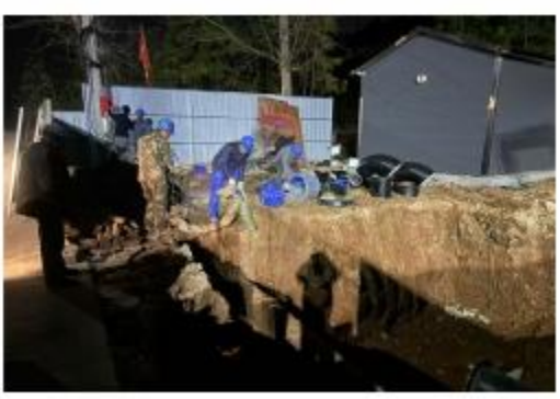
在枯牛洲水厂全面供水前的过渡期内保障片区用水安全，市水务集团精准研判、科学决策，决定在项目用地内先行建设一座临时加压泵房。该泵房采用装配式一体化板房技术，占地约35平方米，兼具有建设迅速、运行可靠的优势，可快速填补过渡期供水保障缺口。

本报讯：12月14日晚，金家山加压泵房顺利实现通水运行。这一关键节点的完成，标志着金家山片区（含宝山工业园、王太还建楼）长期面临的供水压力不足问题得到有效缓解，区域供水保障能力与稳定性实现显著提升。