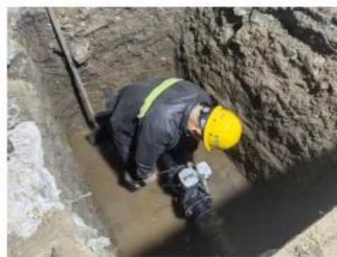
管维公司完成市中心节点DMA流量计安装工作

此次更换的流量计涵盖DN400至DN100多种口径，可匹配市中心不同区域中小管线的运行需求，安装点位遍布老城区各个核心供水节点。DMA流量计是管网流量监测的关键设备，负责实时采集流量数据、反馈管网运行状态。此前，老城区部分中小管线的计量设备覆盖不全，无法满足精细化管理的要求，成了管网管理中的一块短板。