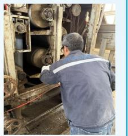
面对突发情况，厂领导高度重视，第一时间部署应急抢修方案。维修班组迅速响应，争分夺秒，在低温和作业环境恶劣情况下开展抢修工作。

本报讯：2025年12月17日上午约10点，正值冬季生产关键时期，山南厂脱水间带式压滤机在运行过程中突发故障，经现场排查，故障原因为压榨段轴承严重损坏，导致设备无法正常运转。